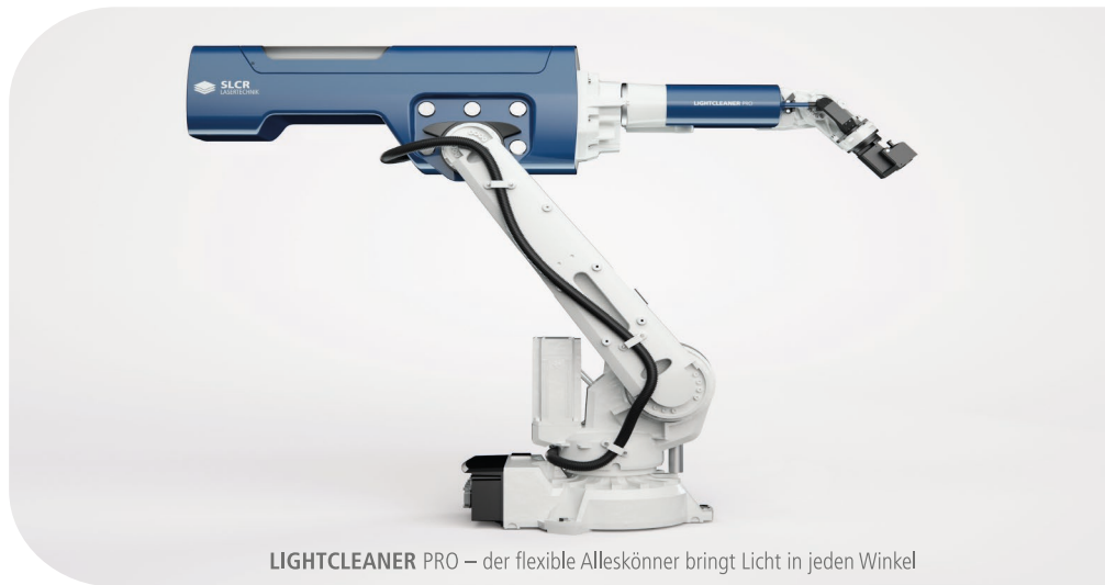
LIGHTCLEANER PRO – der flexible Alleskönner bringt Licht in jeden Winkel

Wir freuen uns auf Ihren Anruf! +49 2423 950 93-0